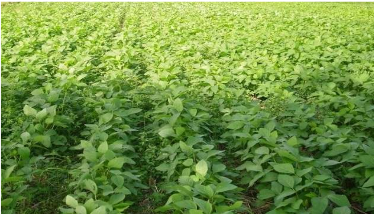
Gambar 1. Kondisi Areal Tanaman Kacang Kedelai di Lokasi Pengambilan Sampel

Pada hakekatnya setiap usaha agraria saat ini berpusat pada penciptaan yang tinggi yang ingin dicapai. Jika didasarkan pada pemahaman tentang kondisi tanah dan hasil pertanian yang perlu dikembangkan, hal ini dapat terlaksana. Produk yang akan dikembangkan untuk menghasilkan hasil terbaik, suatu lahan harus dianalisis dan dievaluasi. Tanaman Kacang Kedelai merupakan salah satu produk hortikultura kelompok buah yang saat ini banyak mendapat perhatian. Karena Kacang Kedelai merupakan sumber vitamin, mineral, dan karbohidrat yang baik. (Ambarita et al.), produksi barang-barang Kacang Kedelai bertujuan untuk memenuhi permintaan buah yang terus meningkat, serta meningkatnya kesadaran penduduk akan pentingnya gizi (Ambarita et al. , 2015). Menurut Komaryati dan Adi (2012), Kacang Kedelai merupakan salah satu tanaman dengan prospek cerah karena hampir semua orang senang memakannya, selain rasanya yang enak, nilai gizi yang tinggi, dan harga yang relatif murah. bahwa barang impor juga terdaftar sebagai eksportir.