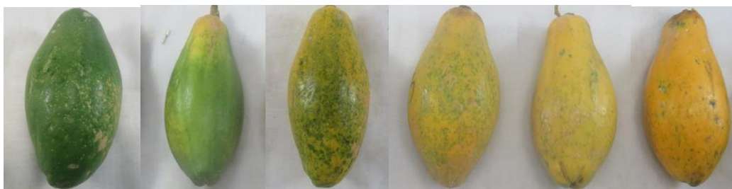
Gambar 2. Perubahan warna pada pepaya Miba; (1) hijau, (2) hijau dengan sedikit kuning. (3)hijau kekuningan, (4) kuning lebih banyak dari hijau, (5) kuning dengan sedikit hijau, (6) kuning penuh