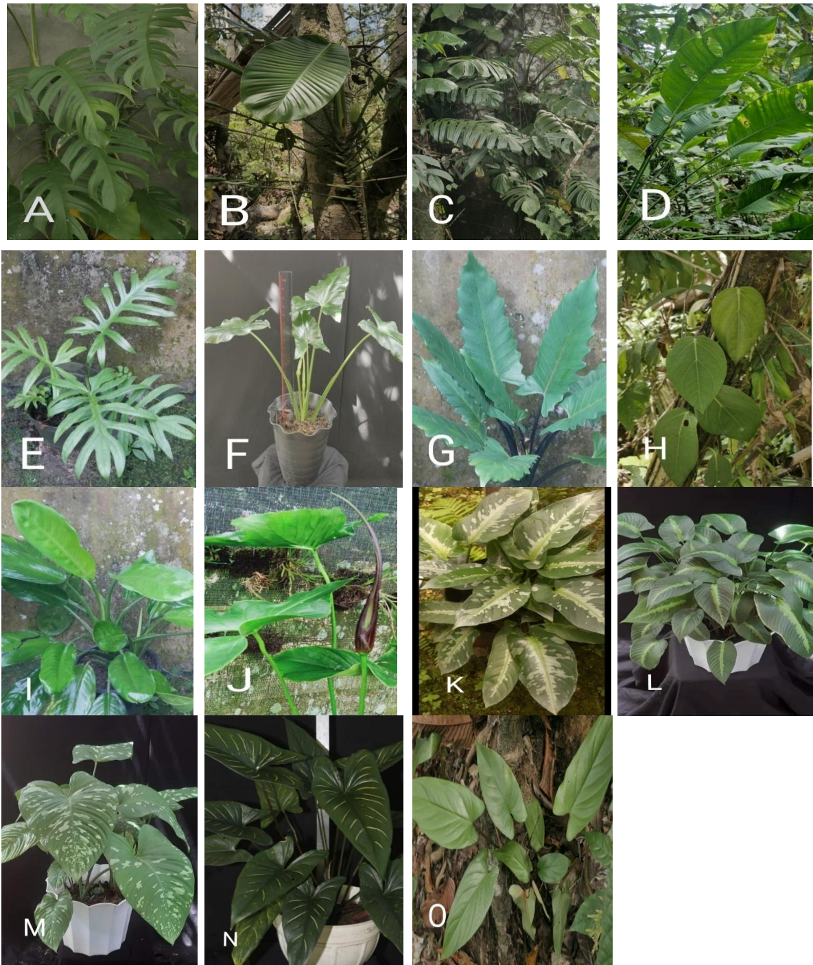
Gambar 3. Keragaman spesies Aroid di Kampung Kwimi.

lamina bulat hingga acute , bentuk lamina ovate-elliptic hingga oblong-lanceolate , apex acute hingga acuminate 24-47 cm x 11-20 cm. Inflorescence beberapa, jarang tunggal ( soliter ), seludang bunga ( spathe ) berbentuk seperti perahu berwarna hijau hingga hijau kekuningan, spadix berbentuk silinder ( cylindrical ) berwarna hijau muda.