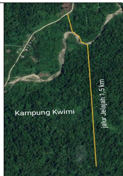
Gambar 1. Peta Lokasi Penelitian