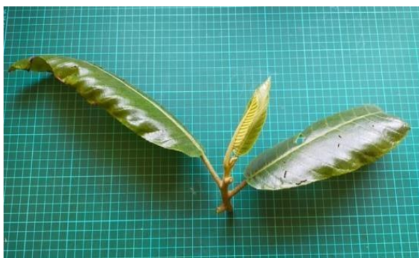
Gambar 1. Daun Saurauia bracteosa yang digunakan sebagai bahan tanam.

Bagian tanaman yang digunakan sebagai bahan tanam atau eksplan adalah daun tanaman Saurauia bracteosa (Gambar 1) yang merupakan koleksi Kebun Raya Eka Karya Bali. Daun disterilisasi dengan empat metode berbeda (Tabel 1). Setelah proses sterilisasi, eksplan ditanam ke dalam botol kultur yang berisi 2 jenis media, yaitu media MS dan WPM. Pada Metode II, III, dan IV botol kultur tersebut ditempatkan pada dua kondisi yang berbeda, yaitu ruang gelap dan terang dengan suhu \pm 20 °C dan lama penyinaran 12 jam pada kondisi terang. Sedangkan pada Metode I semua kultur ditempatkan pada kondisi terang.